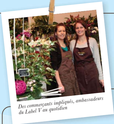
Des commerçants impliqués, ambassadeurs du Label V au quotidien

Fin 2011, 5 centres de commerces Mercialys ont été labellisés.