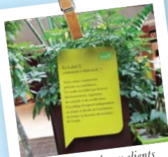
Un label expliqué aux clients

Ecocert est un organisme de contrôle et de certification au service de l'homme et de l'environnement, intervenant dans plus de 80 pays et sur les 5 continents, de la production à la distribution. Les contrôles d'Ecocert apportent une garantie et une traçabilité répondant aux attentes des consommateurs.