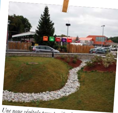
Une noue végétale pour purifier les eaux ruisselantes du parking